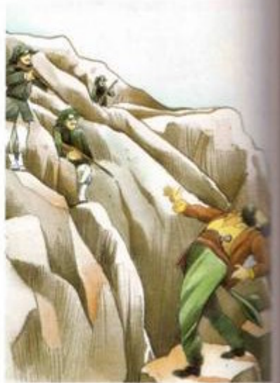
Il disegno rappresenta uno scontro a fuoco tra una pattuglia di soldati italiani e un brigante sulle montagne dell'Aspromonte, in Calabria.

Questo episodio, che fu una vera e propria Guerra civile e che provocò migliaia di morti, ebbe un'altra conseguenza gravissima, perché le plebi meridionali persero ogni entusiasmo per il nuovo Stato italiano e videro i suoi funzionari come degli oppressori.