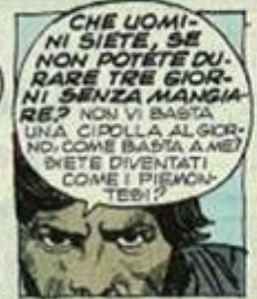
CHE UOMINI SIETE, SE NON POTETE DURARE TRE GIORNI SENZA MANGIARE? NON VI BASTA UNA CIPOLLA AL GIORNO, COME BASTA A ME? SARETE DIVENTATI COME I PISMONTESI?