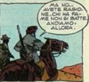
MA NO... AVETE RAGIONE... CHE HA FAME NON SI BATTE ANDIAMO, ALLORA.