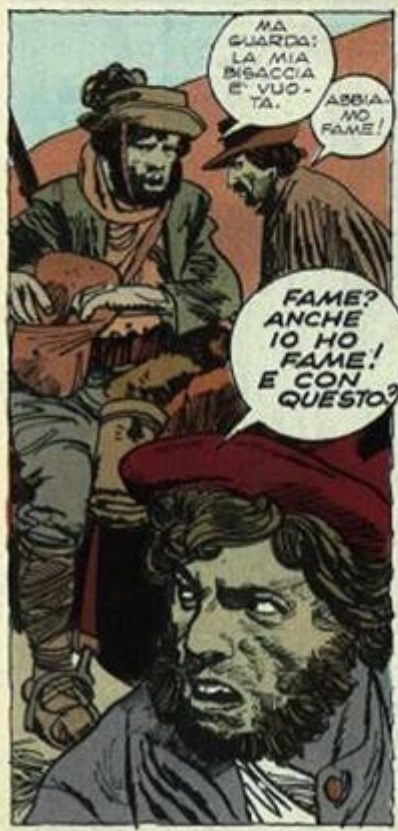
MA GUARDA: LA MIA BISACCIA E' VUOTA. ABBIAMO FAME!