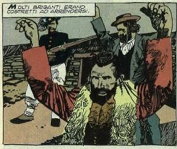
MOLTI BRIGANTI ERANO COSTRETTI AD ARRENDERSI.