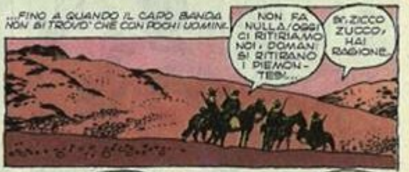
...FINO A QUANDO IL CAPO BANDA NON SI TROVO' CHE CON POCCHI UOMINI.