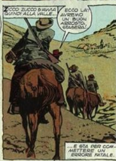
ZICCO ZUCCO DAVVIA QUINDI ALLA VALLE...