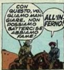
CON QUESTO, VOGLIAMO MANGIARE. NON POSSIAMO BATTERCI SE ABBIAMO FAME!