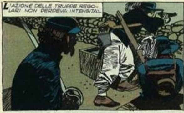
L'AZIONE DELLE TRUPPE REBELLARI NON DERDEVA INTENITAL.